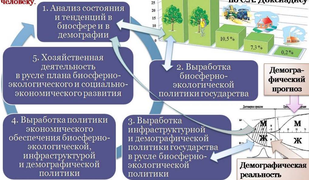
Рис. 1. Взаимная обусловленность частных управленческих задач в ходе реализации концепции устойчивого развития.

Рис. 1 нуждается в пояснениях. В каждом регионе, обладающем физико-географическим своеобразием, интегральный биосферно-экологический показатель — распределение земель между: 1) заповедными зонами с первозданной природой, 2) зонами, в которых природная среда доминирует, но имеет место